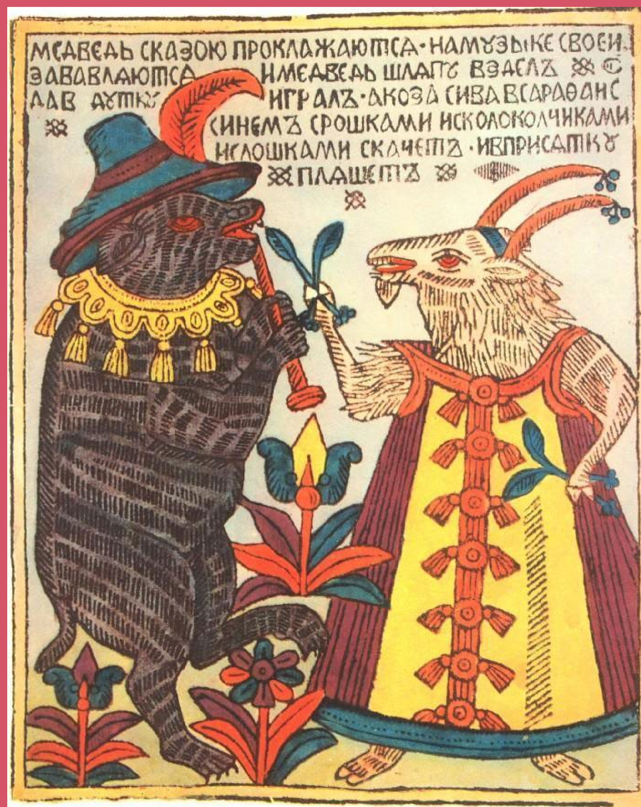
Медведь с козю. Лубок XVIII века.

Луб – это древесина, очищенная от коры. На деревянных досках вырезали изображение, а потом особым образом прижимали доску к бумаге. На бумаге отпечатывалось изображение – оттиск, который называли лубочной картинкой.